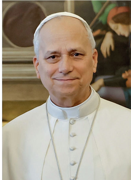
Léon XIV le 13 octobre 2025.

Sa feuille de route comme Pape est bien la doctrine sociale de l'Église qui offre les repères d'une « pensée dynamique fidèle à l'Évangile » pour affronter de multiples défis à l'ère de l'intelligence artificielle. L'enjeu est crucial, il s'agit de la « protection de la personne humaine » à l'heure de bouleversements profonds engendrés par les évolutions technologiques et la révolution numérique. Un discernement est à opérer entre la logique de la tour de Babel « où l'œuvre commune est guidée par un projet de domination qui finit par déshumaniser » ou celle de la reconstruction de Jérusalem au temps de Néhémie, « une œuvre de responsabilité partagée » (MH 90). Pour ce discernement orienté vers l'action, la tradition de la pensée sociale de l'Église est une ressource précieuse et incontournable. Léon XIV la rappelle, l'actualise et en démontre la fécondité pour affronter les défis d'aujourd'hui notamment celui qu'il exprime avec vigueur : « désarmer l'IA ! C'est-à-dire « non pas renoncer à la technologie, mais l'empêcher de dominer l'humain » (MH 110).