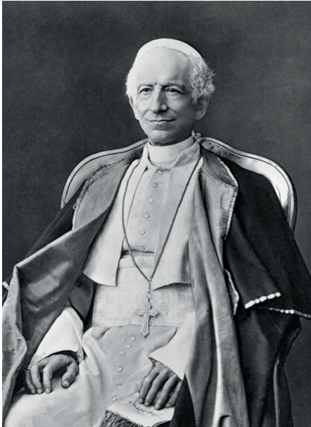
Léon XIII le 11 avril 1878.

Peu de temps après son élection, Léon XIV avait expliqué le choix de son nom par le fait qu'il souhaitait s'inscrire dans le sillage du pape Léon XIII et de Rerum novarum , la grande encyclique sociale initiant la doctrine sociale dans sa forme contemporaine. Avec Magnifica humanitas (MH), sa première encyclique, signée un an plus tard le 15 mai 2026 – jour anniversaire des 135 ans de Rerum novarum – il confirme son choix.