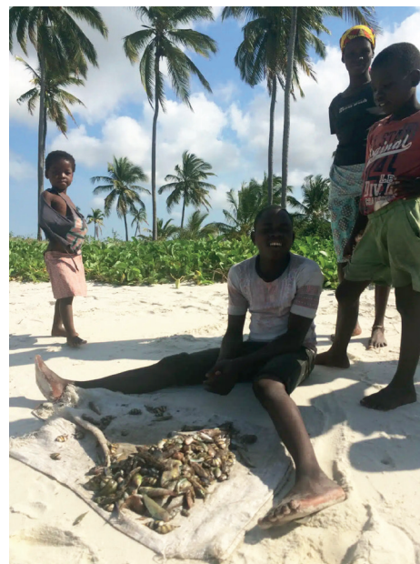
Au Mozambique, dans la province de Cabo Delgado, la présence de TotalEnergies met les populations en danger.