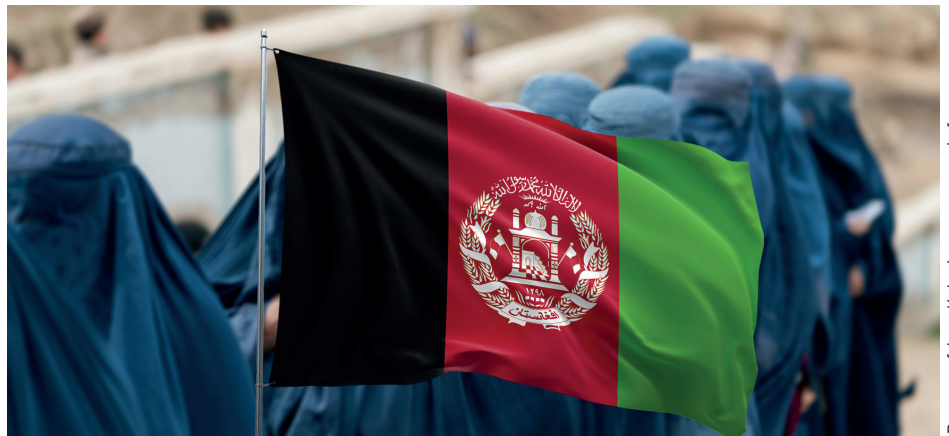
Drapeau afghan déployé sur un groupe de femmes en burqa bleue traditionnelle